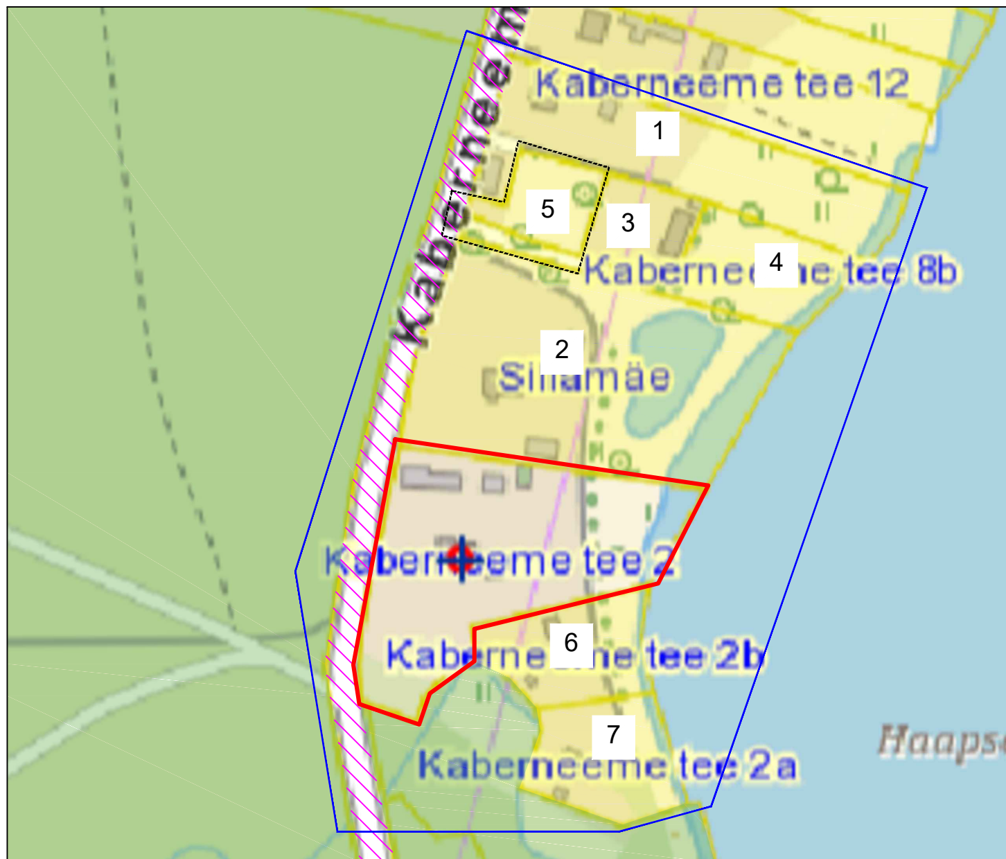
Eluhoonete vahelised kaugused kontaktvööndis, M1:4000